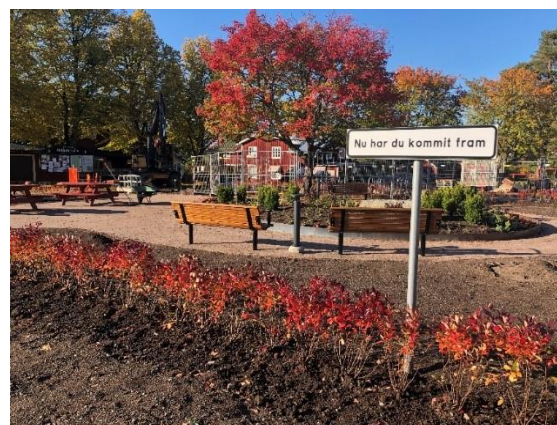
Möklinta torg, Helreovering av torget.

Parksidan har under året genomfört ett stort antal projekt och har i stort sett gjort av med de investeringsmedel som var avsatta.